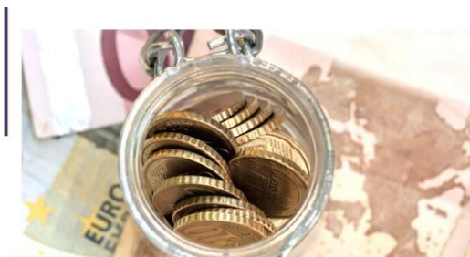
LPA izstrādātās ētiskā finansējuma vadlīnijas nosaka arī caurskatāmību attiecībā uz finansējuma avotu identitāti

Turpinot šī gada iesākto apņemšanos izstrādāt virkni politiku, lai veicinātu pašregulāciju un labu pārvaldību LPA biedru un kopumā nevalstiskā sektora vidū, kā arī izplatītu labo praksi, LPA ir pabeigusi darbu pie LPA ētiskā finansējuma vadlīniju izstrādes. Vadlīnijas paredz procedūru, kas jāievēro LPA, izvērtējot, vai pieņemt finansējumu; kritērijus, lai novērtētu iespējamus ētiskus riskus, kas saistītas ar potenciālo finansējumu un finansētāju; caurskatāmības pamatprincipus saistībā ar finansētāju, finansējumu un tā izlietojumu.