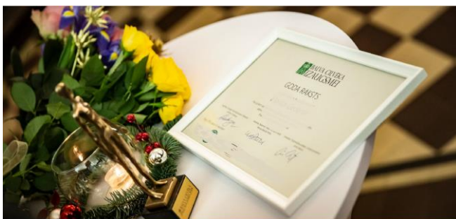
Noteikti “Balva cilvēka izaugsmei” laureāti

4. augustā Zoom platformā tikās Balvas “Cilvēka izaugsmei” žūrijas locekļi, lai noteiktu konkursa laureātus. Žūrijas komisija vienojās par uzvarētājiem katrā kategorijā, kā arī par specbalvas piešķiršanu. Paldies visiem pieteicējiem, par veltīto laiku un nomināciju iesniegšanu! Balvu saņēmēji tiks paziņoti svinīgā ceremonijā, kuras laiks un formāts vēl tiek precizēts.