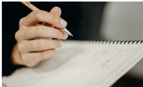
10. augustā notiks pirmā Stratēģiskās plānošanas komitejas tikšanās

10.augustā, uzsākot darbu pie NVO fonda 2021.gada prioritāšu izstrādes, notiks pirmā Stratēģiskās plānošanas komitejas (*SPK) tikšanās. Tikšanās laikā plānots izskatīt: