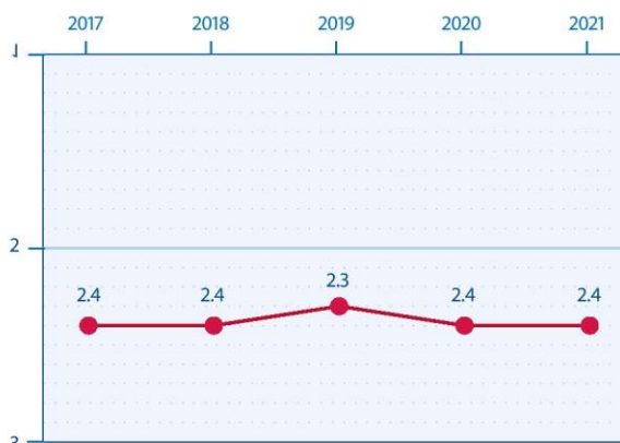
PAKALPOJUMU NODROŠINĀJUMS LATVIJĀ

2021. gada janvārī LPA un Valsts kanceleja uzsāka Sadarbības domnīcas projektu. Projekts apvieno dažādas ieinteresētās puses, tostarp organizāciju, valdības un uzņēmumu pārstāvjus, kā arī iesaista citu jomu profesionāļus ar mērķi rast risinājumus konkrētiem jautājumiem sabiedrības līdzdalībā – labas pārvaldības, līdzdalības un pilsoniskās sabiedrības ilgtspējīga finansējuma jomās.