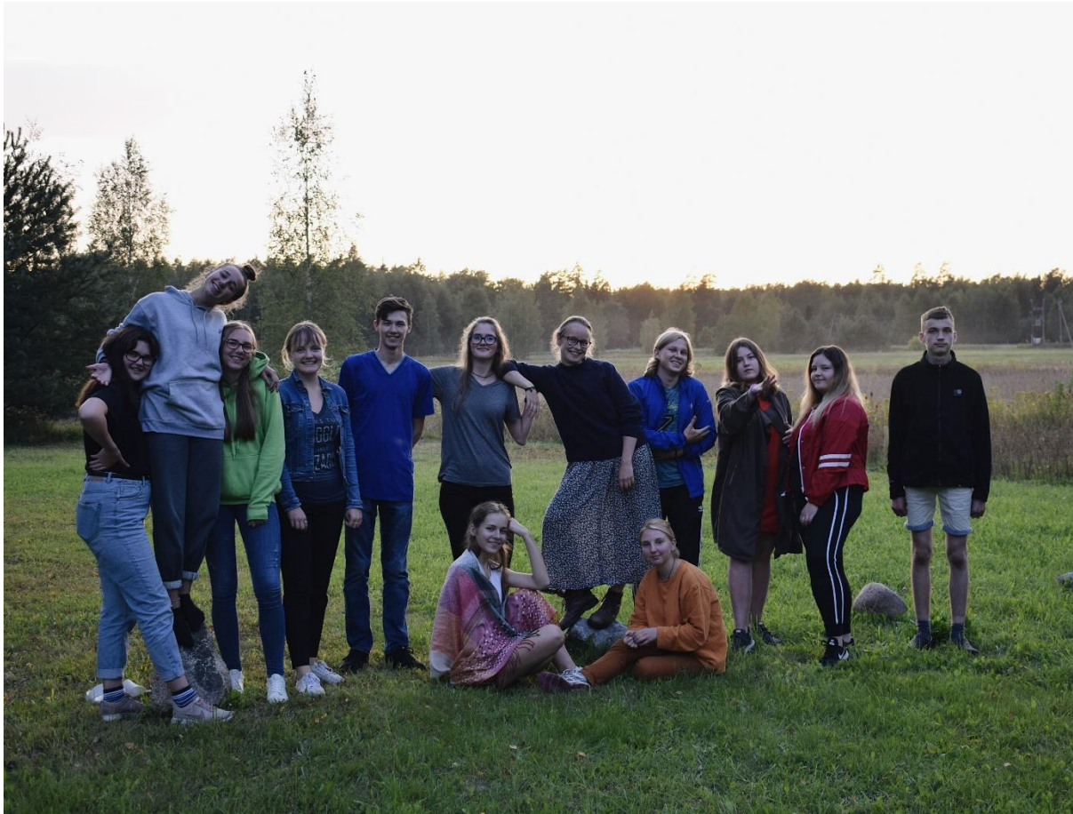
Klubs "Māja" rīkotā nometne jauniešiem "ES un demokrātija" 2019. gada augustā

brīvprātīgo no Vācijas un Turcijas uzņemšana, nodrošinot tiem pēc iespējas pozitīvāku gūto pieredzi Latvijā.