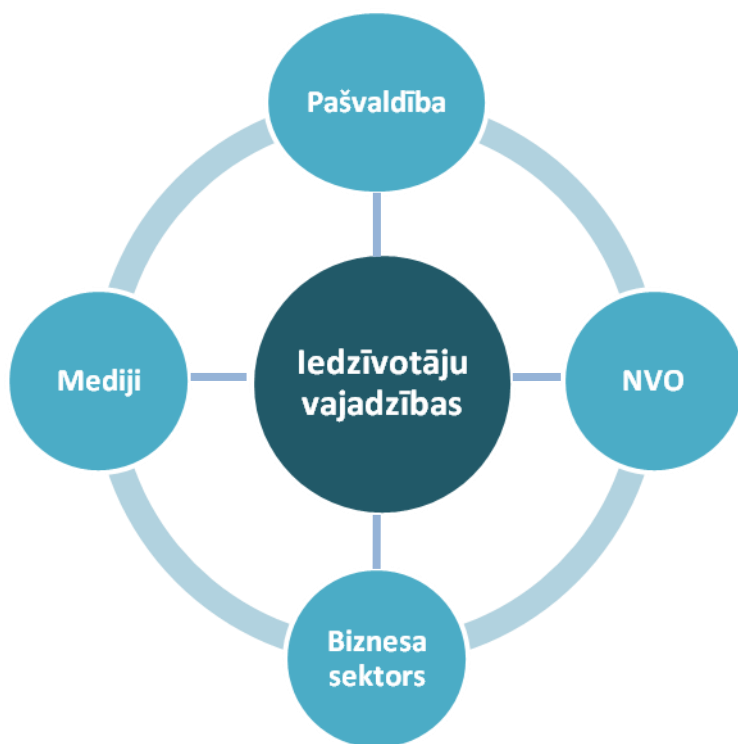
1.attēls. Sektoru sinerģija.

Sektoru sinerģijā iesaistīto pušu kompetences: