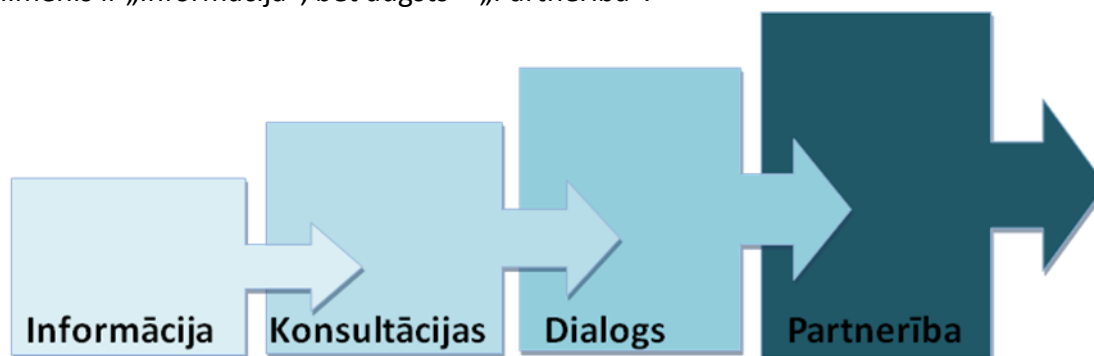
3.attēls. Līdzdalības līmeņi.

Eiropas Padome ir identificējusi četrus līdzdalības līmeņus lēmumu pieņemšanas procesā, kas ir universāli pielietojami jebkurā izpildvaras vai likumdevējvaras pārvaldes līmenī: informācija, konsultācijas, dialogs un partnerība (skat.3.attēls. Līdzdalības līmeņi.). Katram līmenim ir piešķirta vērtība lēmumu pieņemšanas procesā. Tiek uzskatīts, ka zems līdzdalības līmenis ir „Informācija”, bet augsts – „Partnerība”.